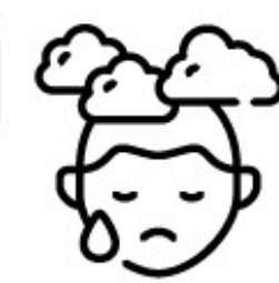
Personne en situation de pauvreté

« Tu fais juste recevoir, recevoir, recevoir... »