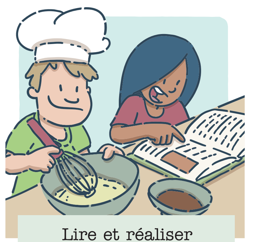
Lire et réaliser une recette