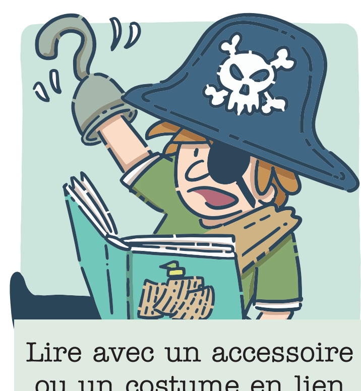
Lire avec un accessoire ou un costume en lien avec l'histoire