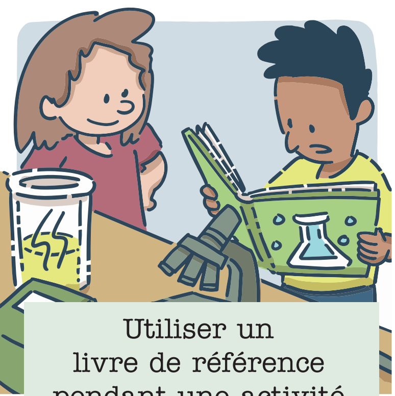
Utiliser un livre de référence pendant une activité scientifique