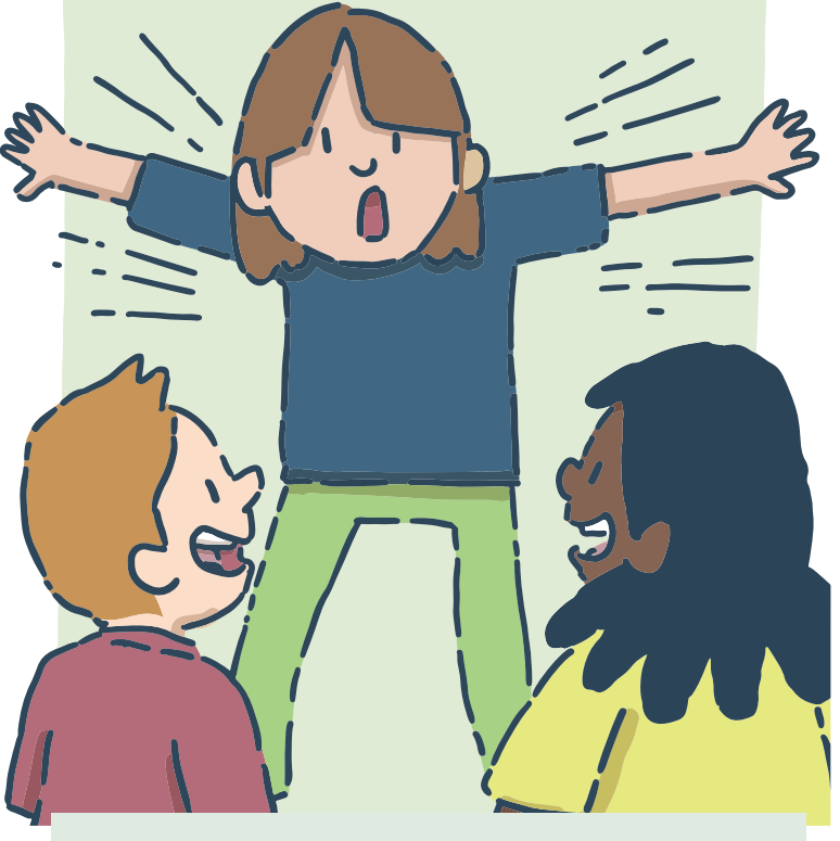
Faire des charades