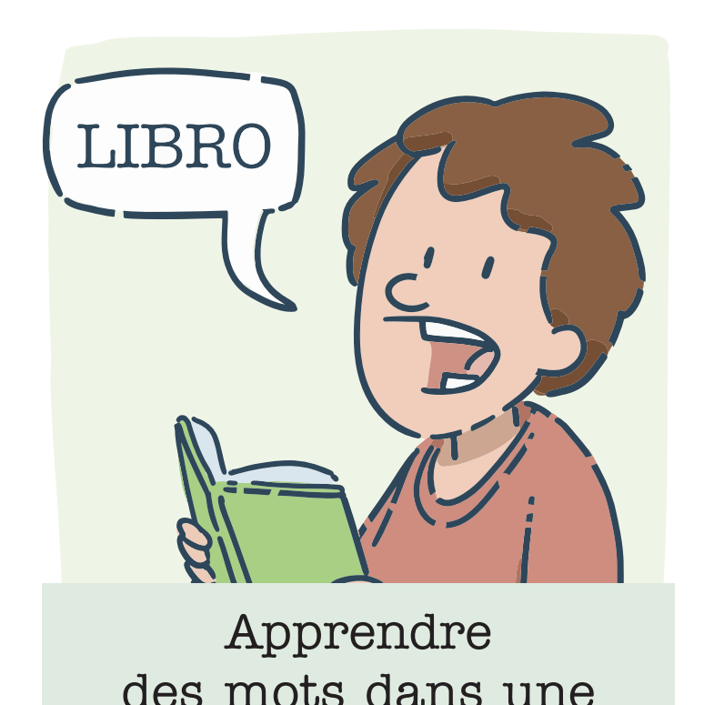
Apprendre des mots dans une autre langue