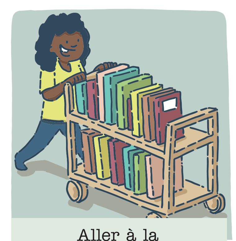
Aller à la bibliothèque