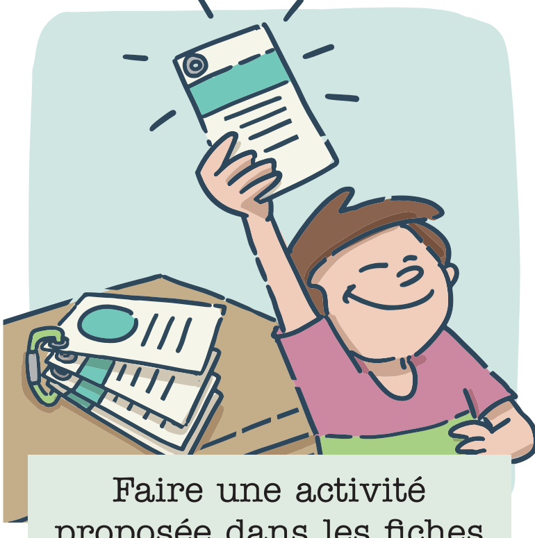
Faire une activité proposée dans les fiches Lit de camp