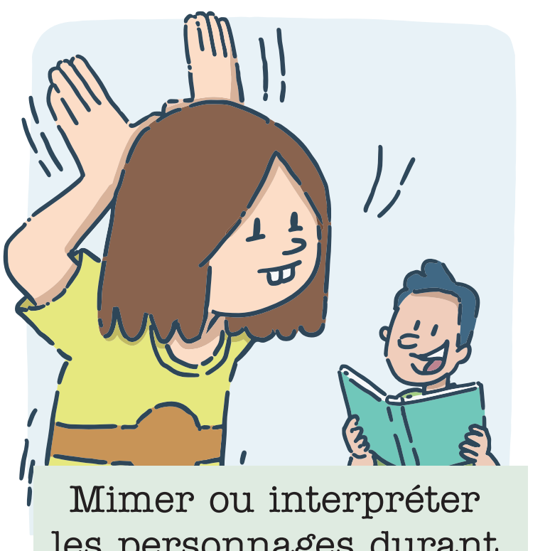
Mimer ou interpréter les personnages durant la lecture d'une histoire