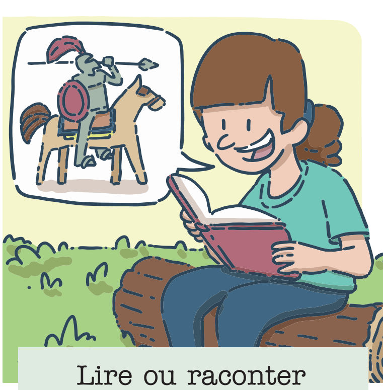
Lire ou raconter une légende