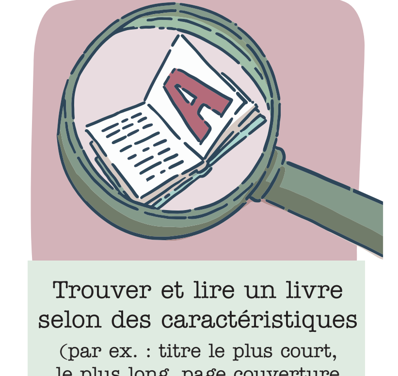
Trouver et lire un livre selon des caractéristiques (par ex. : titre le plus court, le plus long, page couverture la plus colorée, etc.)