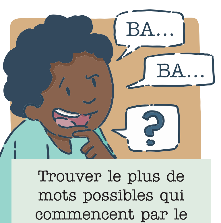
Trouver le plus de mots possibles qui commencent par le même son