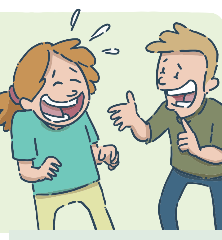
Raconter des blagues