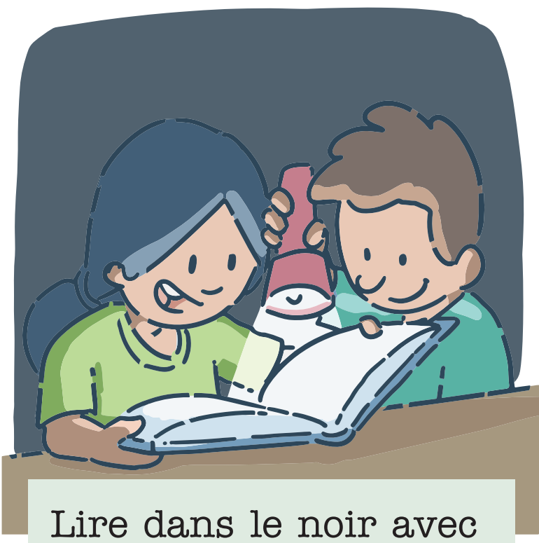
Lire dans le noir avec des lampes de poche