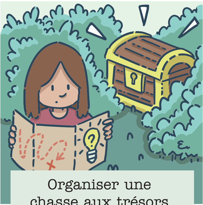
Organiser une chasse aux trésors à l'aide d'indices