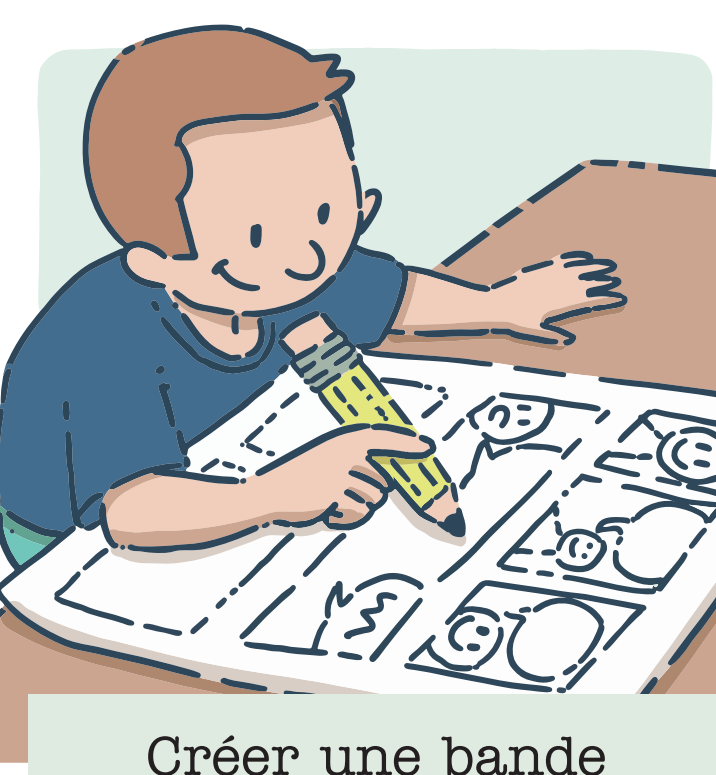
Créer une bande dessinée