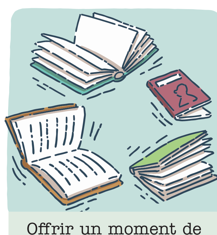
Offrir un moment de lecture libre