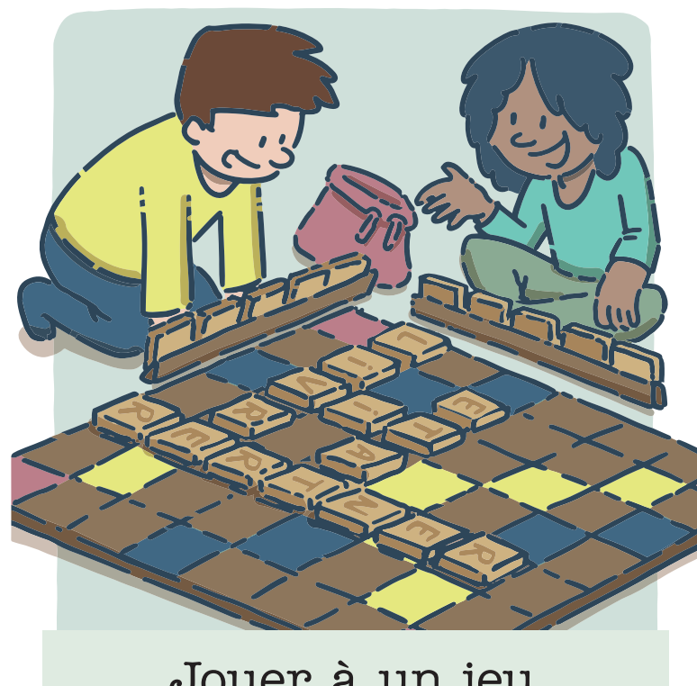
Jouer à un jeu de société