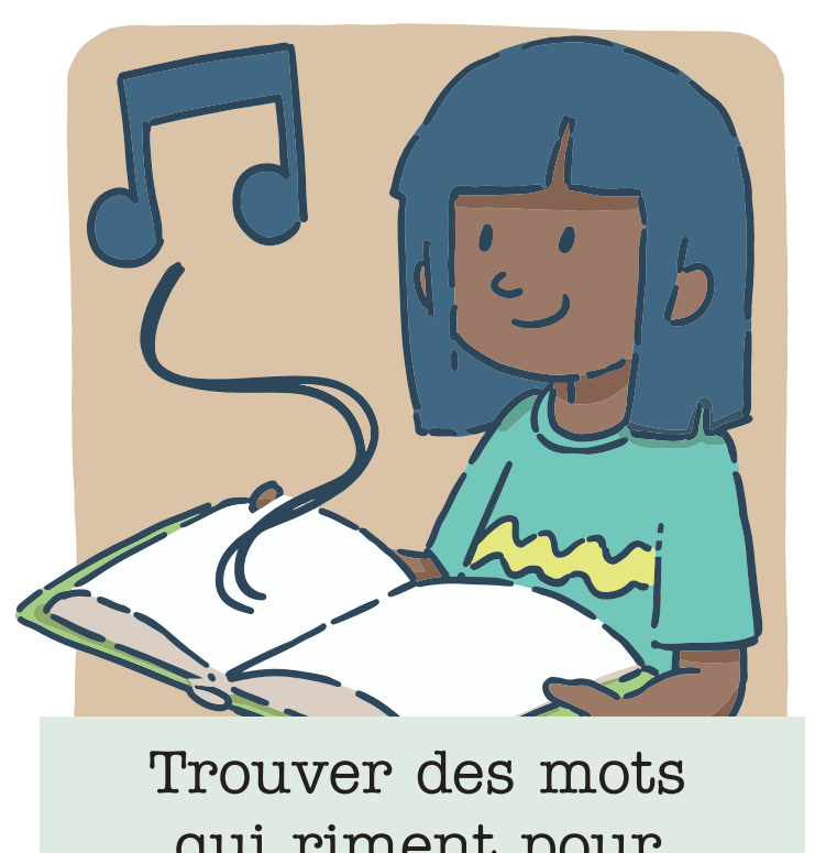
Trouver des mots qui riment pour créer une chanson