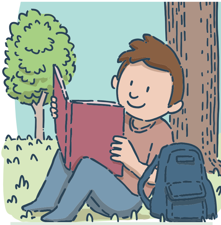
Lire au parc