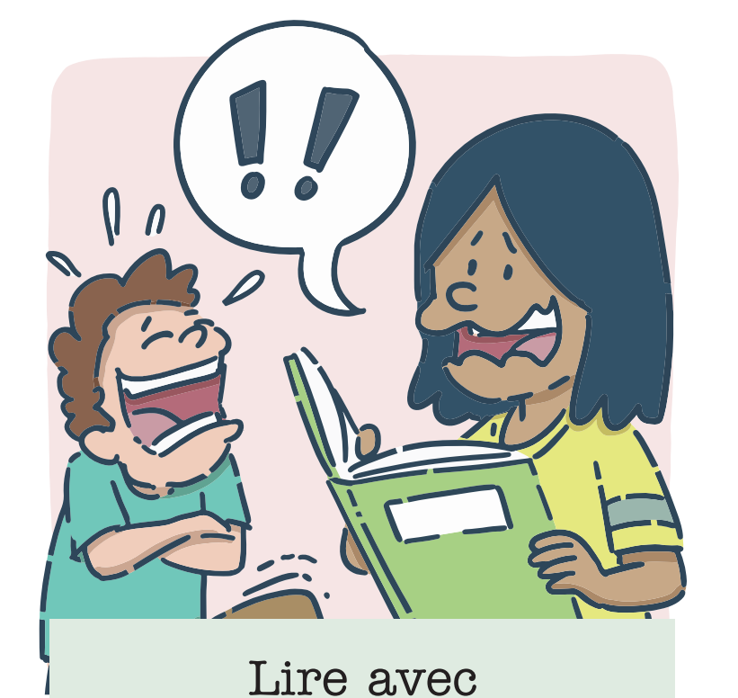
Lire avec une drôle de voix