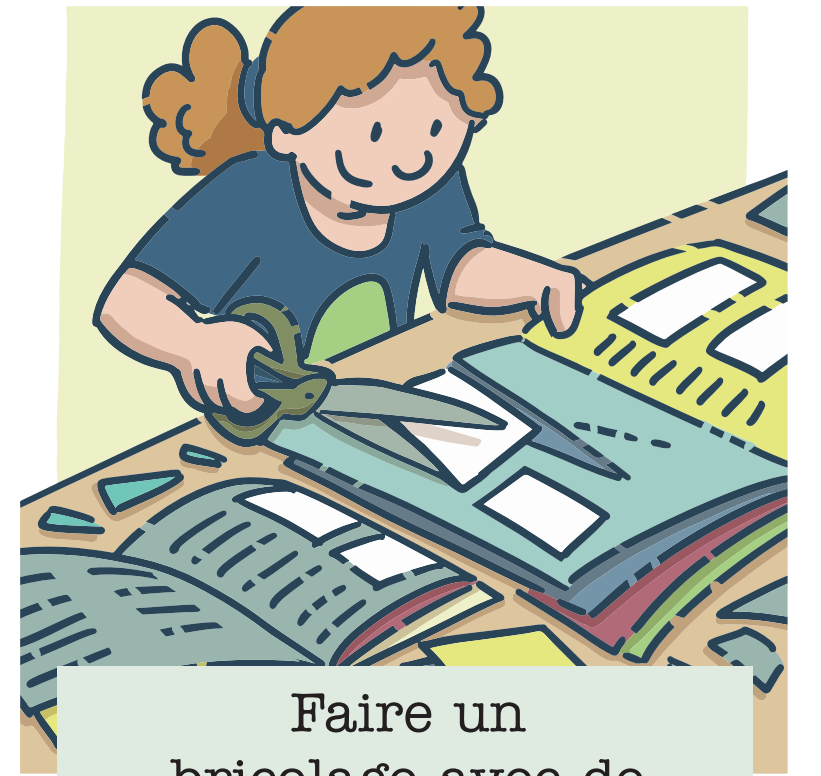
Faire un bricolage avec de vieux magazines