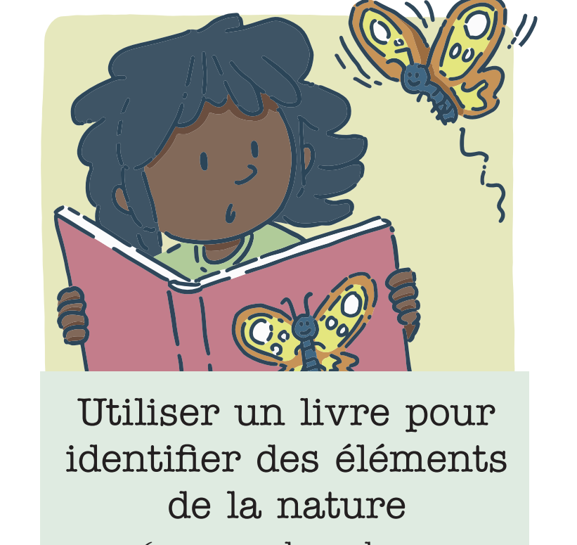
Utiliser un livre pour identifier des éléments de la nature (par ex. : les arbres, les insectes, les roches, etc.)