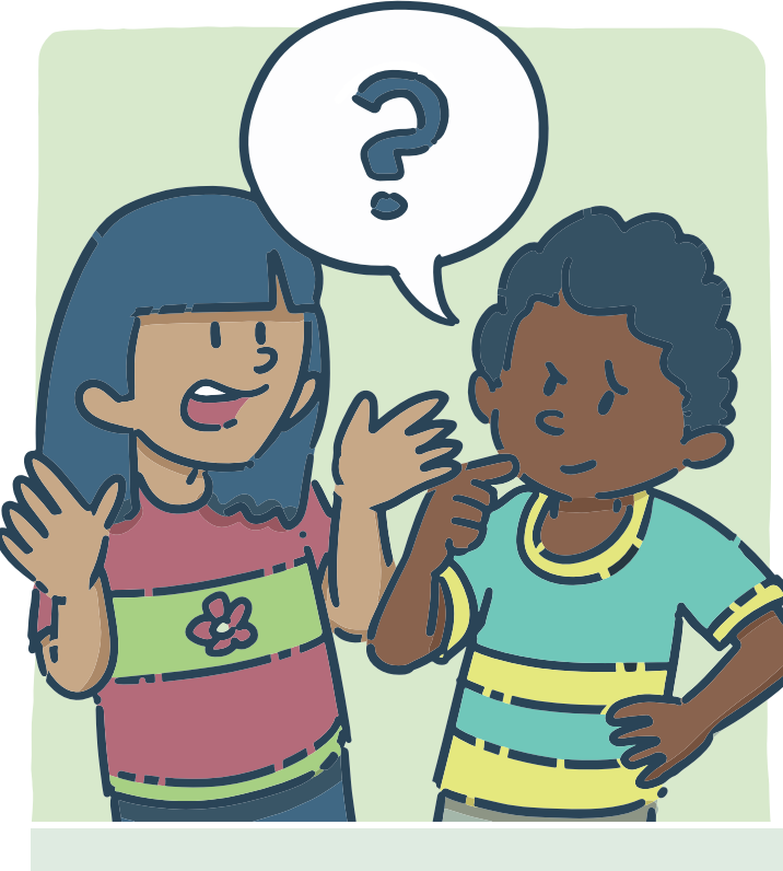
Faire des devinettes